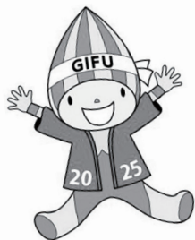
マスコットキャラクター ミナモ

◆テーマ：清流に輝け ひろがれ 長寿の輪 ◆会期：2025年10月18日(土)～21日(火) (日程や会場は種目によって異なります)